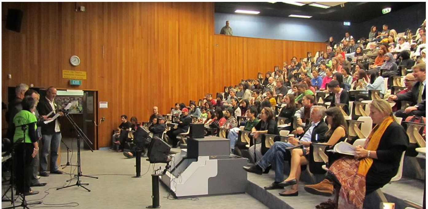
Jen foto kiam la esperantistoj kantis Waltzing Matilda en Esperanto.