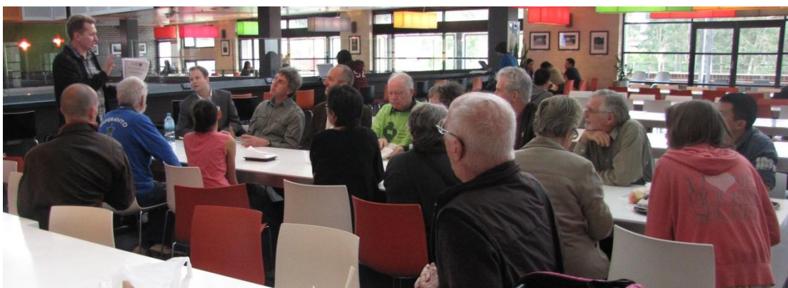
La Esperantistoj manĝas en la manĝalono