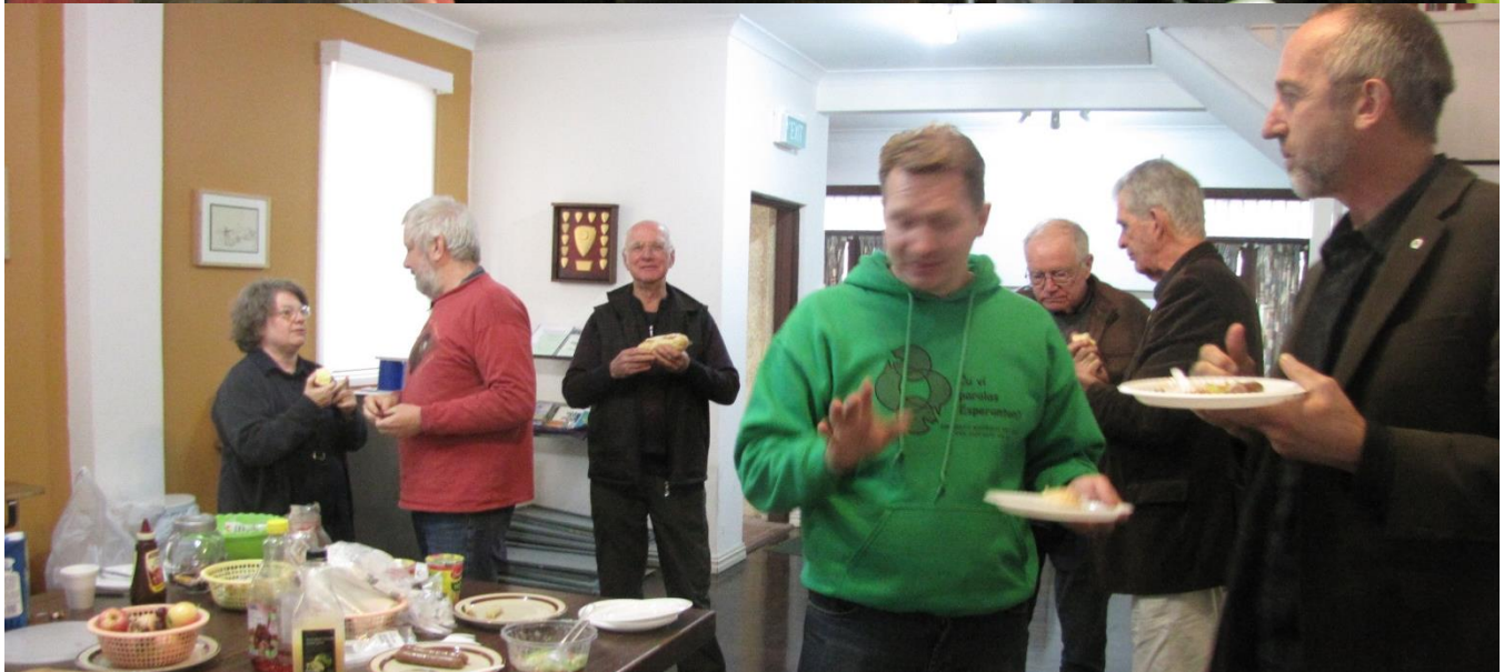
Lasta tago de SLF ĉe Esperanto Domo 2a Junio