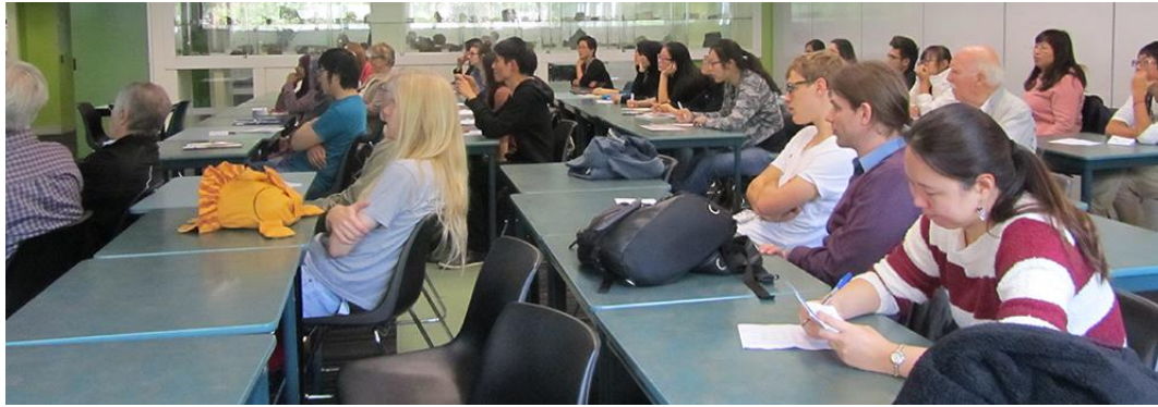
Jen la ĉeestantoj de la Esperanto-leciono la 1an de junio ĉe SLF