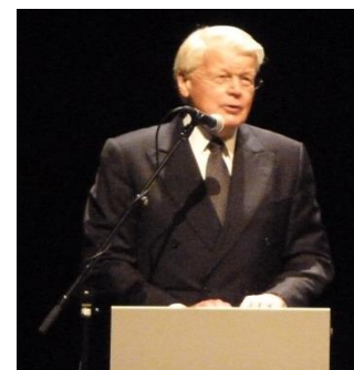
Prezidento de Islando

Dek du aŬstraliaj esperantistoj partoprenis en la Universala Kongreso en Rejkjaviko (21a ĝis 28a Julio 2013). Rejkjaviko situas sur la sudokcidenta marbordo de la insulo. La popolo nombras nur 320,000 en la insulo kaj 200,000 en Rejkjaviko. Iom pli ol mil Esperantistoj vojaĝis tien kaj ĝuis la belan ĉirkaŭaĵon kaj la amikecan atmosferon de la kongreso. Kiel kutime multaj interesaj temoj estis