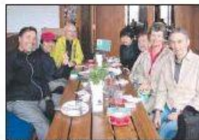
Manly Esperanto Club meets at the Bavarian Bier Cafe.

IN AN ideal world everyone would be able to speak the same easy-to-learn, second language.