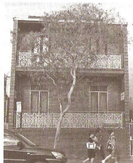
Esperanto-domo de Sidnejo