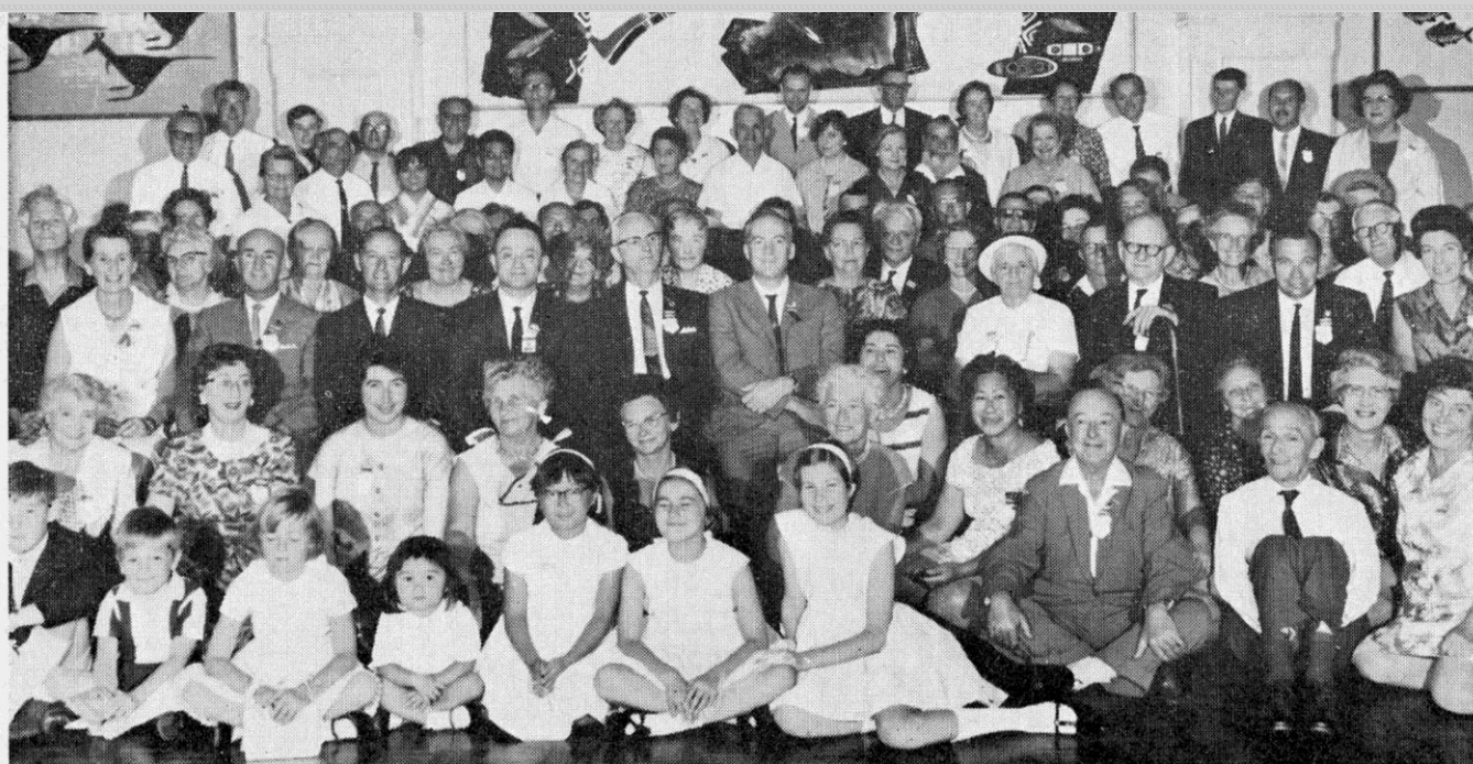
16th Australian Esperanto Congress, Manly, N.S.W., 1-7 January, 1968

La Angla Sekcio instigis kelkajn Esperantistojn pigre skribi al AE. „Aŭstraliaj Esperantistoj“ subtenas Esperanton kaj devas ne esti krokodila novaĵletero. Mi ne plu metos Anglan Sekcion en nian novaĵleteron. Se gravega mallonga anonco pri Esperanto celas novulojn mi tamen metos ĝin en la angla. Roger