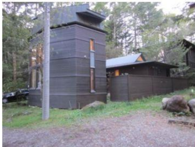
Esperanto-domo en Jacugatake