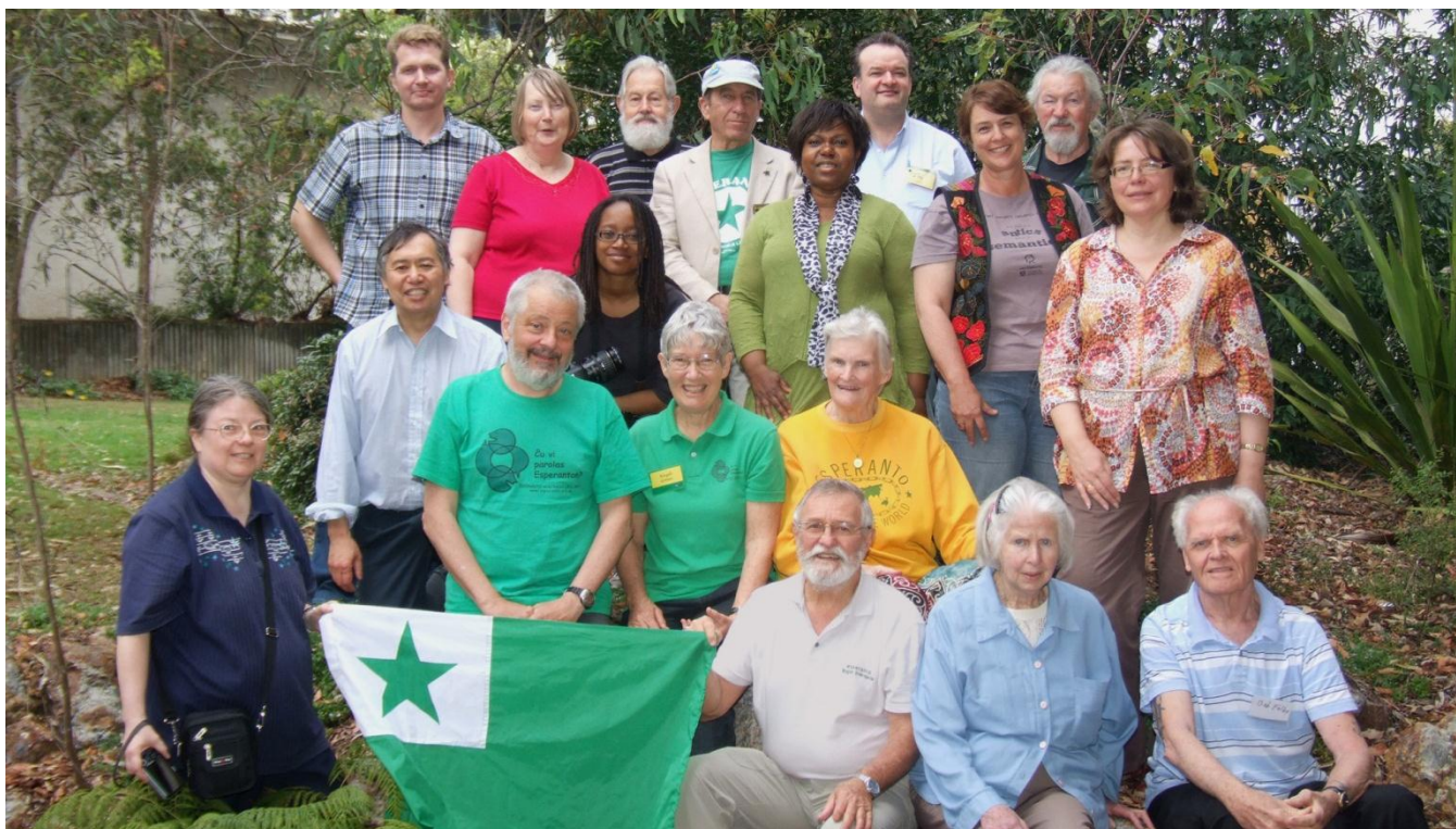
AEA kunveno 2012 Brisbano Griffith University Mt Gravatt Campus