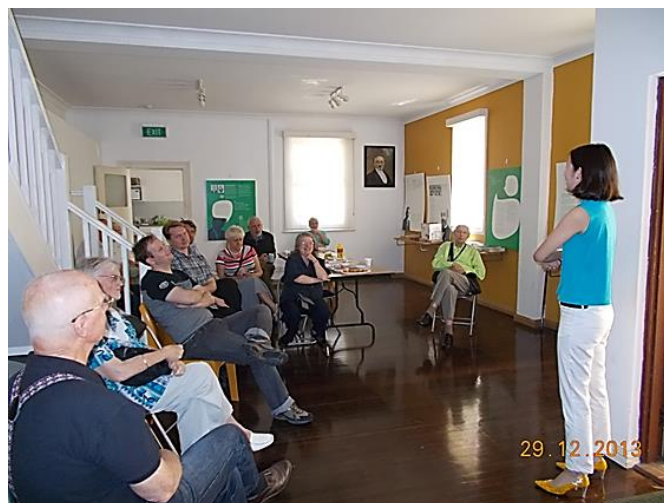
Lumera (el Koreio) prelegis