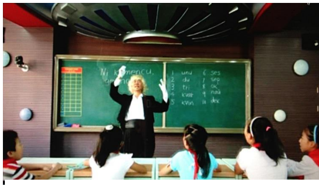
Filmero de la venkinta filmeto en la 'Aŭstralia Populara Elekto'