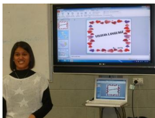
Avita prezentas 'Visayan', unu el la multaj lingvoj en la Filipinoj