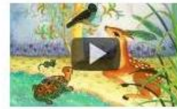
The Four Friends

Mi mem tradukis la 9 rakontojn. La rakontoj estas laŭlegataj de diversaj personoj, 3 el ili estas aŭstralianoj el Sidnejo, unu estas usona.