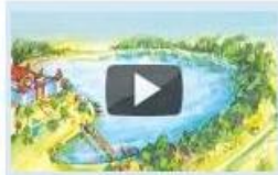
The First Well

Sur la oficiala retejo de BookBox http://www.bookbox.com/ vi nun povas elekti Esperanton (en la skatolo post Change language) kaj spekti 9 rakontojn.