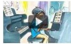
The Little Pianist