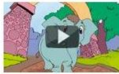
Elephant Goes to the City