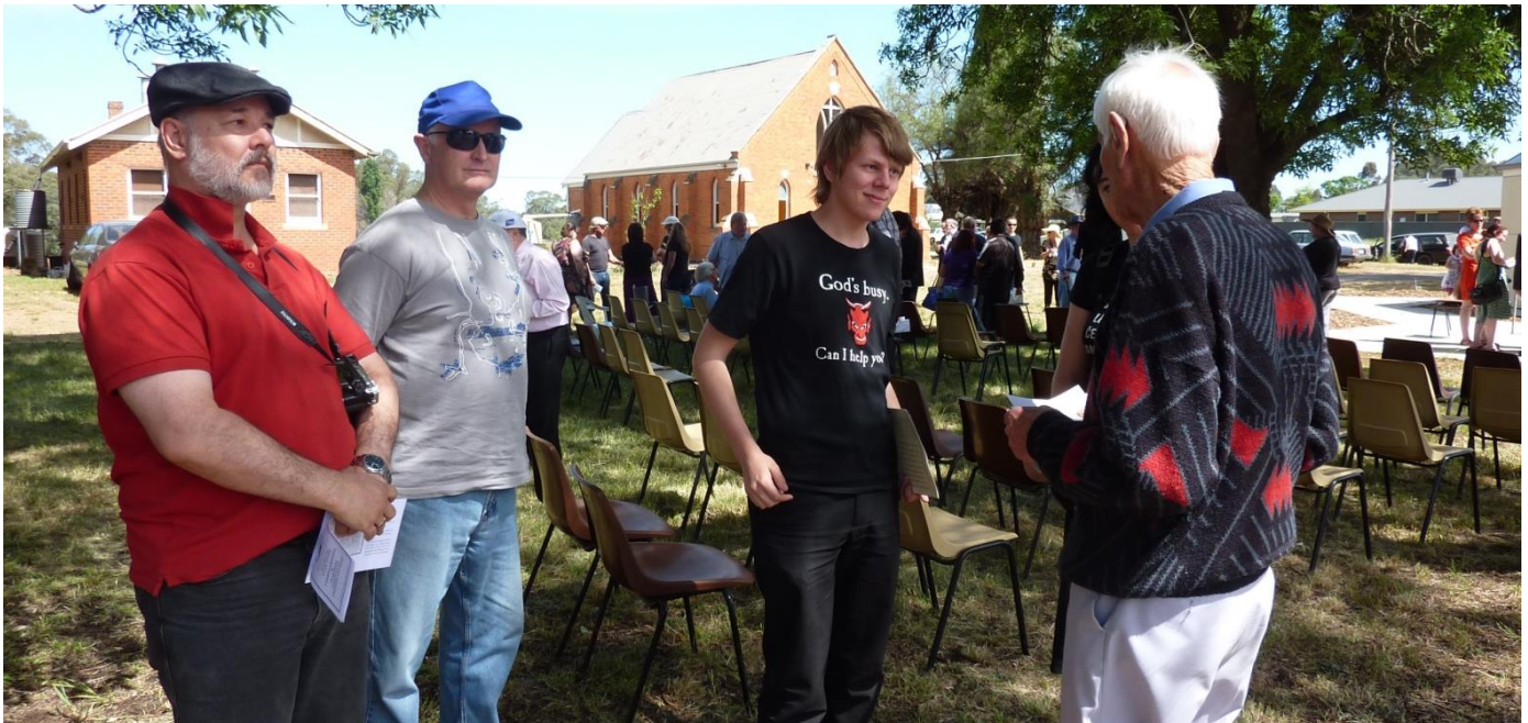
La novaj esperantistoj parolas kun la plej malnova esperantisto

– Mi bedaŭras ke la tempo ne permesis al ni pli longe paroli kun la lokaj loĝantoj. Aparte kelkaj virinoj miris kiel Esperanto povis ludi tiun gravan rolon kaj faris multe da demandoj pri la lingvo. Eble iam ni havos la surprizon renkonti esperantistojn el Carisbrook !