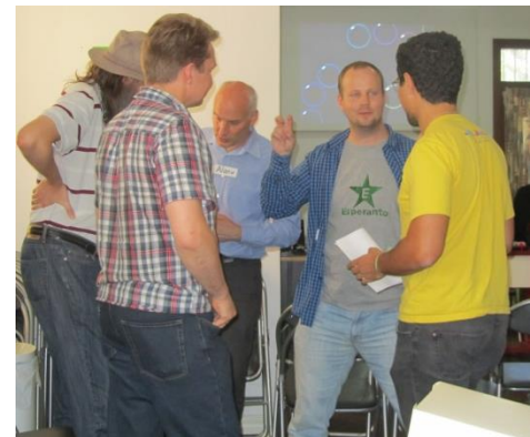
Sukcesa Festo Amika etoso Esperantujo