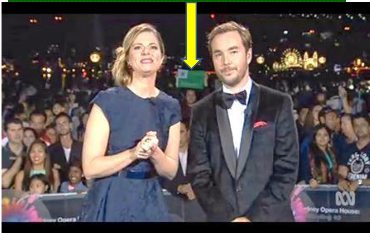
Sidneja TV elsendis ĉirkaŭ la mondo 31 Dec 2014 (ankaŭ la Esperanto-flagon de Ilia)