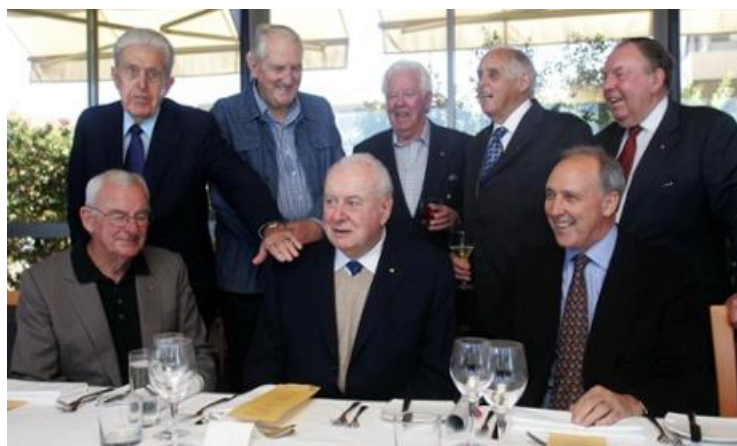
Kep kun Gough Whitlam