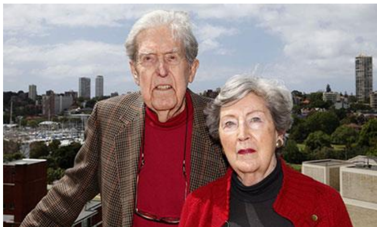
Kep kun Dorothy