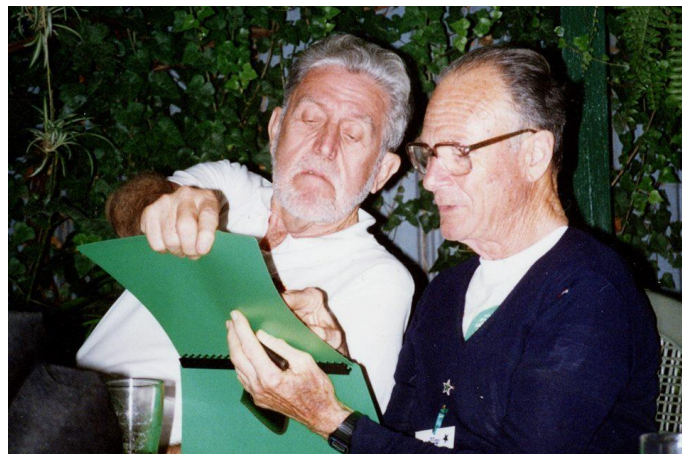
Kep kun Tasmania esperantisto en 1996