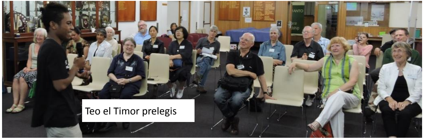
Teo el Timor prelegis