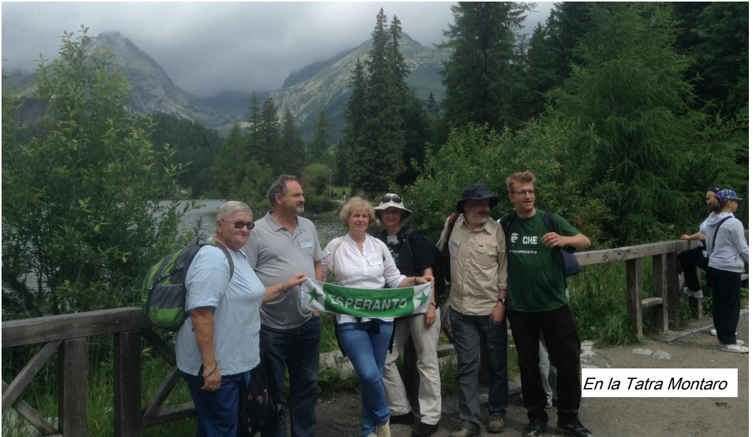
En la Tatra Montaro