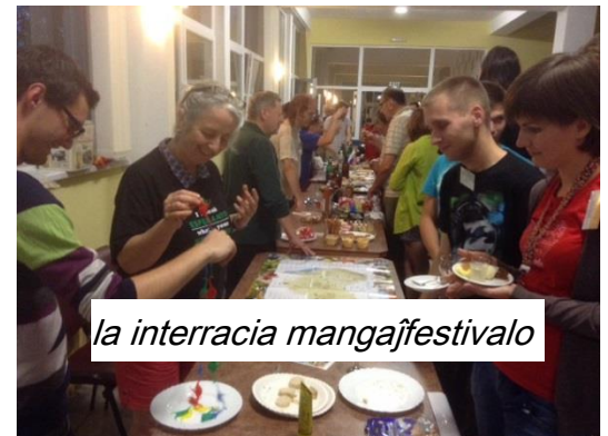
la interracia mangajfestivalo