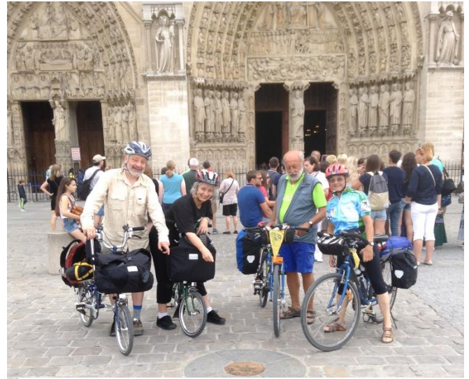
Antaŭ la "nulo punkto". De tie oni mezuras la distancojn en Francujo.