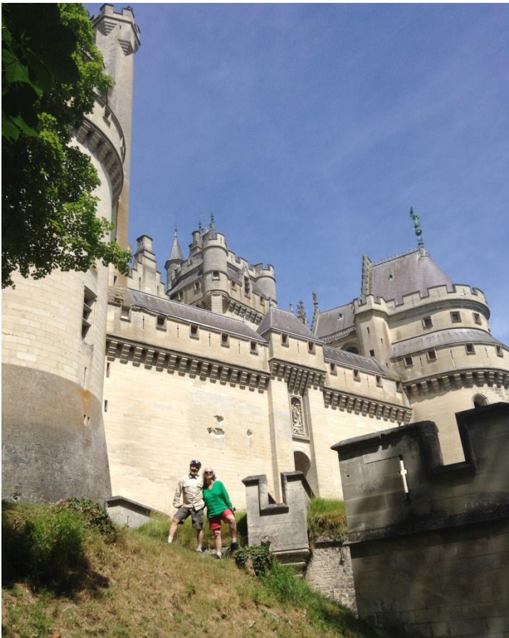
Antaŭ la kastelo de Pierrefonds