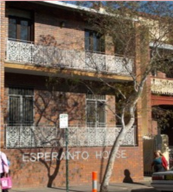
Nuna aspekto de Esperanto Domo Sidnejo

La adresaro de "Aŭstraliaj Esperantistoj" estas uzata por sendi aliajn gravajn informojn.