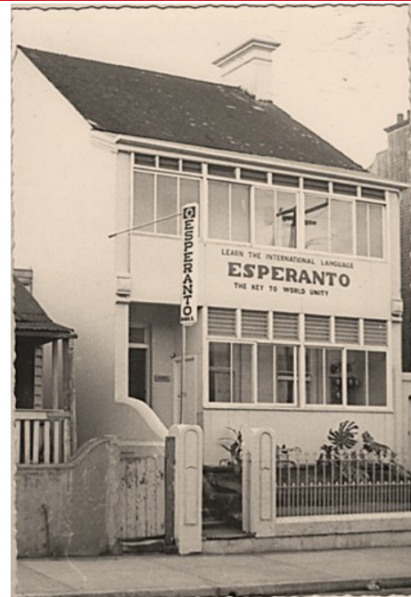
Malnova bildo de ED Sidnejo