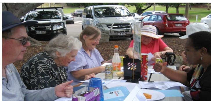
Kelkaj Esperantistoj en Regino Parko