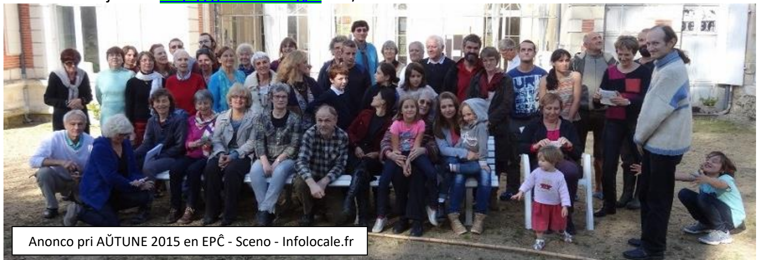
Anonco pri AŬTUNE 2015 en EPĈ - Sceno - Infocale.fr

> Kursoj dum 7 tagoj por komencantoj, progresantoj kaj instruontoj, 24. Oktobro - 1. Novembro 2016 Informoj rete < http://gresillon.org/a >. > /Bonvenon!