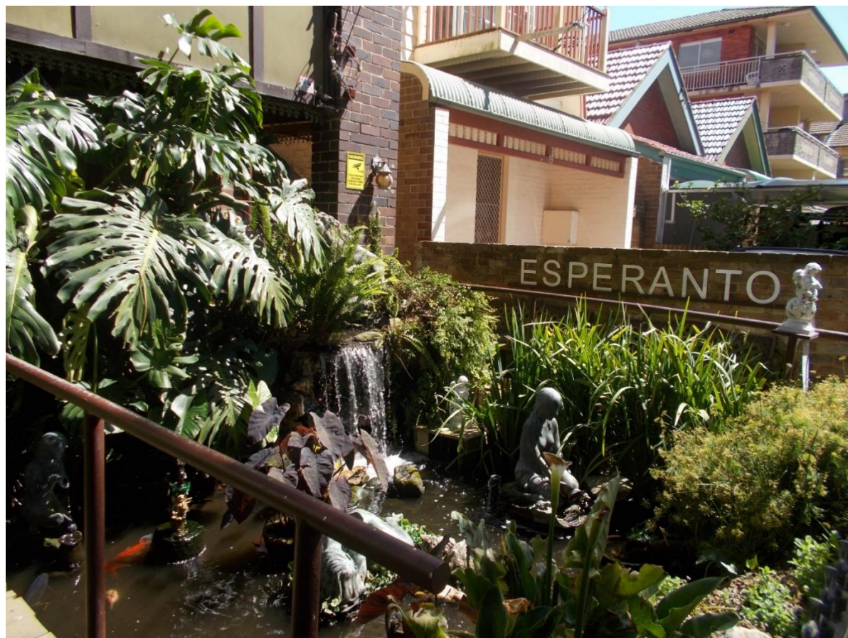
Mia ĝardeno inter la strato kaj la domo