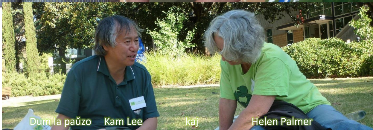
Dum la paŭzo