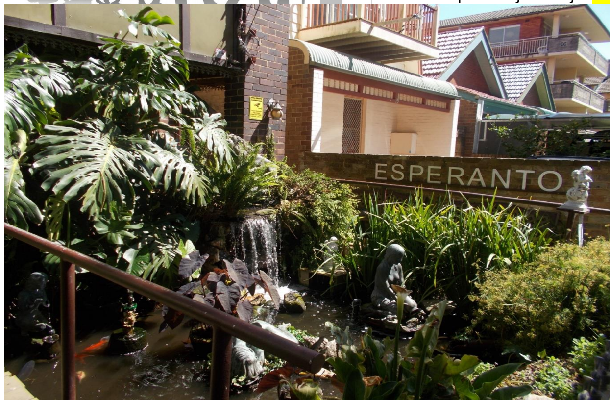
Mia ĝardeno antaŭ de mia domo