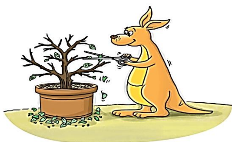
Illustration: Xia Qiang/GT

GT Voice: Pessimism eroding China-Australia trade ties - Global Times