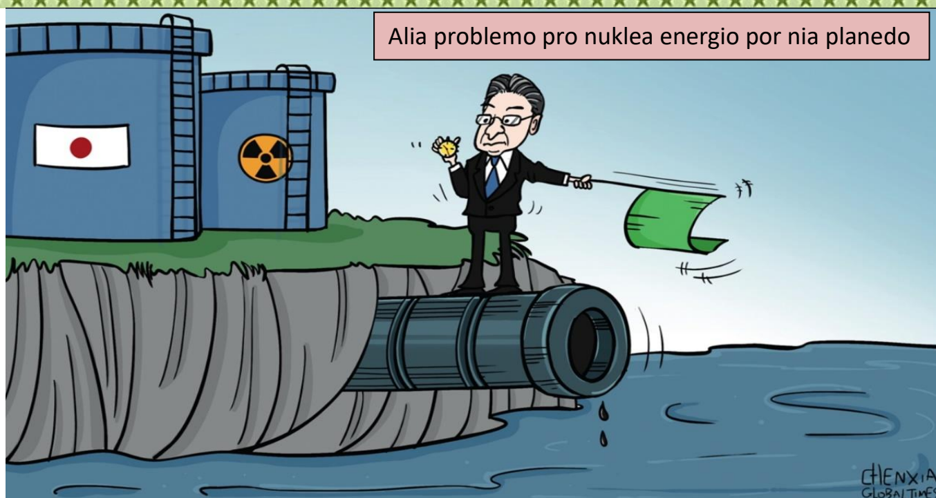
Kishida triggers backlash by saying dumping Fukushima nuclear water can't be delayed - Global Times

Ĉu la registaro aŭ Dio povas aŭ volas puni tiujn viktoriajn homojn kiuj ne obeis la virusoregulojn kaj tiel ne malhelpis la multajn nunajn mortojn pro la viruso? Marcel Leereveld.