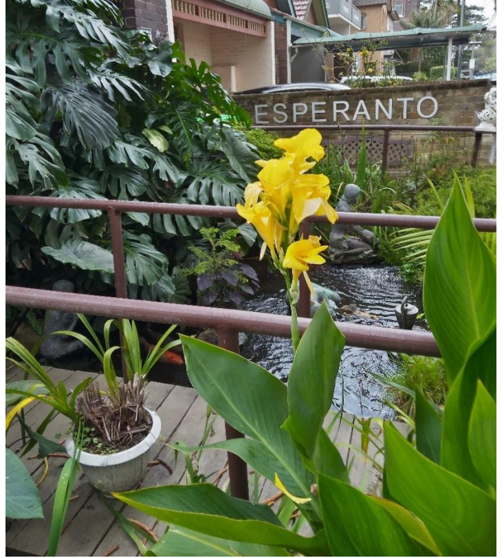
La aŭtoenirejo por kvar domoj. Antaŭe mi sole prizorgis ĝin. Mia antaŭa ĝardeno. Foto el aŭtoenirejo.