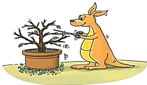
Illustration: Xia Qiang/GT

GT Voice: Pessimism eroding China-Australia trade ties - Global Times