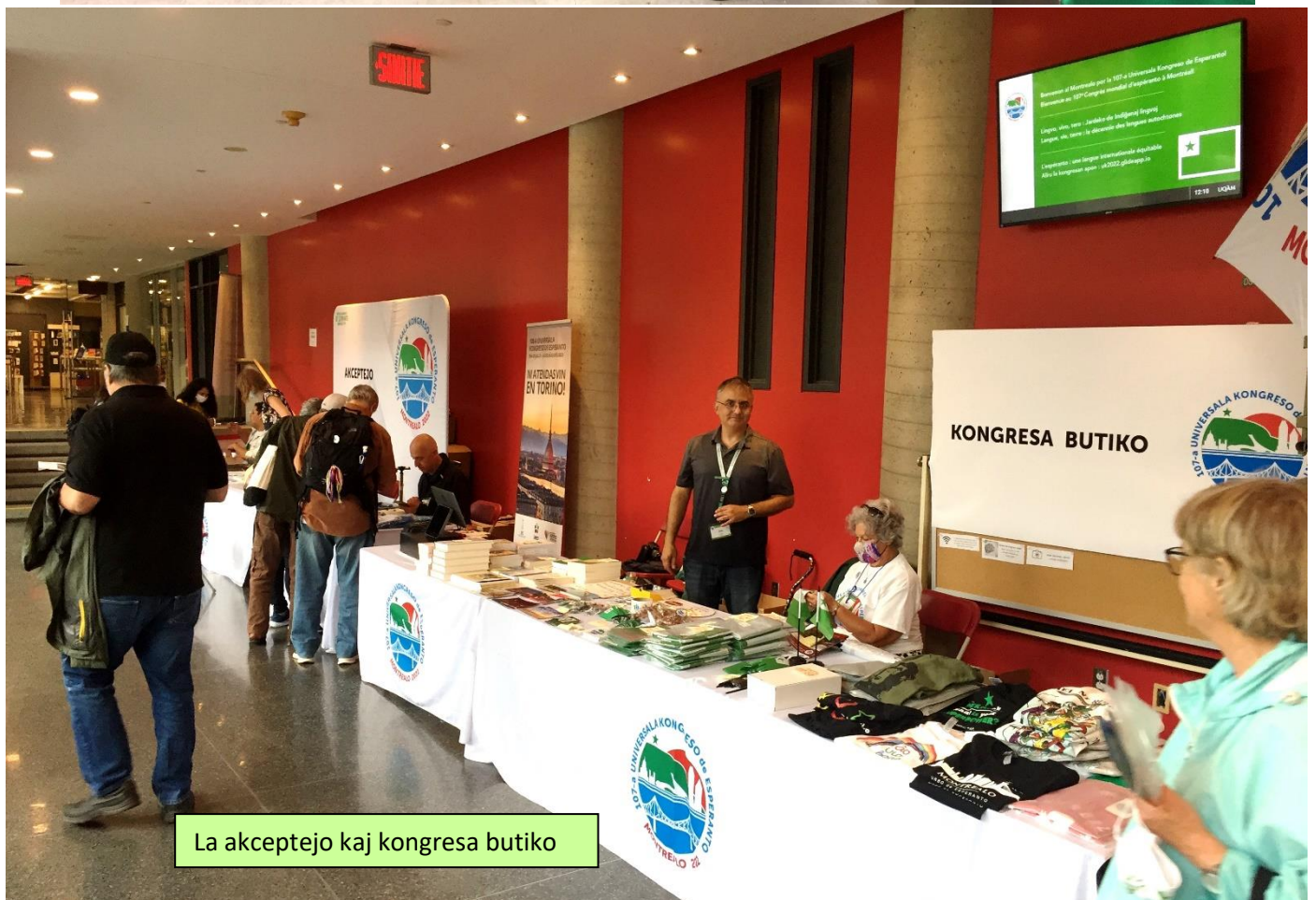
La akceptejo kaj kongresa butiko