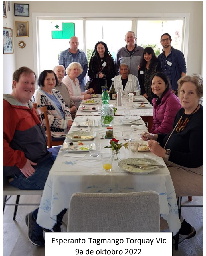
Esperanto-Tagmango Torquay Vic 9a de oktobro 2022