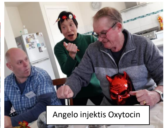
Angelo injektis Oxytocin