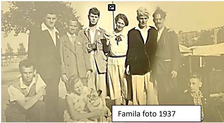
Familia foto 1937