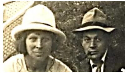
Gepatroj de Marcel