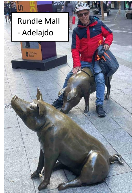
Rundle Mall - Adelajdo