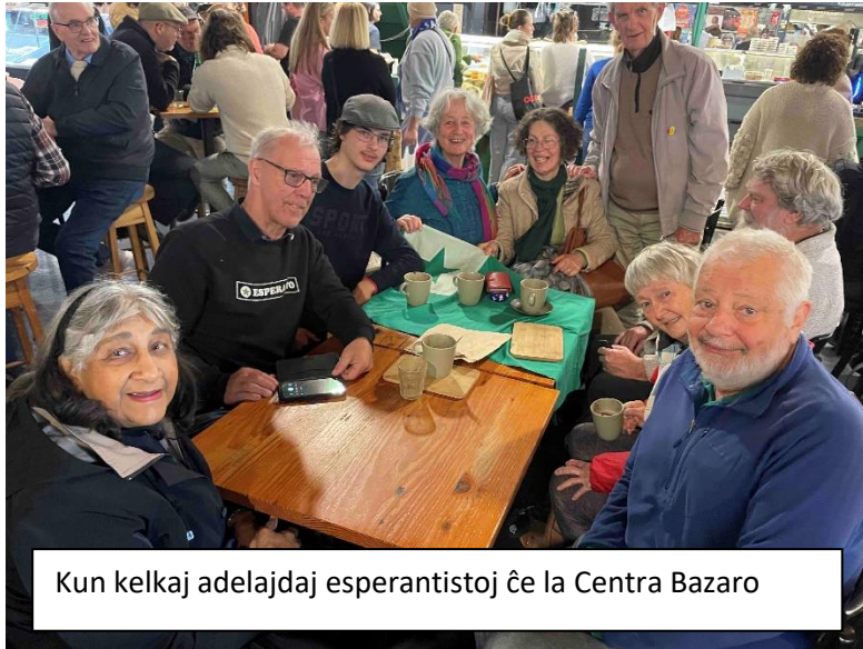
Kun kelkaj adelajdaj esperantistoj ĉe la Centra Bazaro